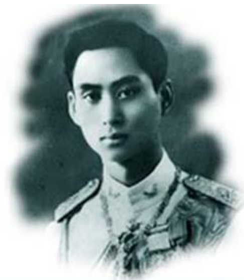
มูลนิธิอานันทมหิดล

พระบาทสมเด็จพระบรมชนกาธิเบศร มหาภูมิพลอดุลยเดชมหาราช บรมนาถบพิตร รัชกาลที่ 9 ทรงพระกรุณาโปรดเกล้าโปรดกระหม่อมพระราชทานพระราชทรัพย์ส่วนพระองค์จัดตั้งมูลนิธิอานันทมหิดล ในปี พ.ศ. 2502 เพื่อให้บัณฑิตนักศึกษามีผลการเรียนดีเด่น ได้มีโอกาสไปศึกษาหาความรู้ชั้นสูงในต่างประเทศ และนำองค์ความรู้ที่ได้มาช่วยพัฒนาประเทศต่อไป